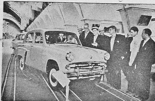
На снимке: в павильоне «Машиностроение». Посетители осматривают легковой автомобиль «Москвич» новой модели.

шую угольную машину «ПКГ-2», на которой установлен мировой рекорд проходки — 1.130 погонных метров выработки в месяц, более совершенные угольные комбайны «К-26» и «КН-1». Поражает своей величиной рабоче-кокселье гидротурбины Куйбышевской ГЭС, вес которого составляет 426 тонн, а диаметр — более девяти метров. Макеты Братской, Куйбышевской и других сооружений гидроэлектростанций свидетельствуют о размахе работ на великих стройках.